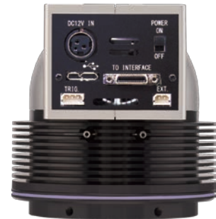
USB3.0とPCIeに標準対応 画像記録用 BPU-30対応

BU-60シリーズは、低価格・コンパクトボディでありながら本格的な冷却により、ノイズを抑えて微弱発光を捉える長時間露光でも高いS/N比を可能にした冷却CCDカメラシステムです。16bitシングルと12bitデュアルA/Dの切り替えで用途に合わせた設定が行え特殊なカメラもラインナップ。EM-CCD搭載モデルは冷却によりゲイン増倍率のアップを実現し、紫外領域対応モデルも用意。全モデルでUSB3.0通信とPCIe通信に標準対応し、オプションの画像記録用インターフェースを使うことで長時間記録も可能。顕微鏡への取付けから装置組み込みまで、各種用途でご利用いただけます。