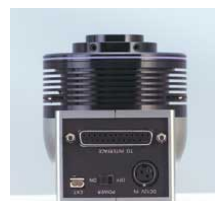
PCIタイプ (30m迄延長可能)